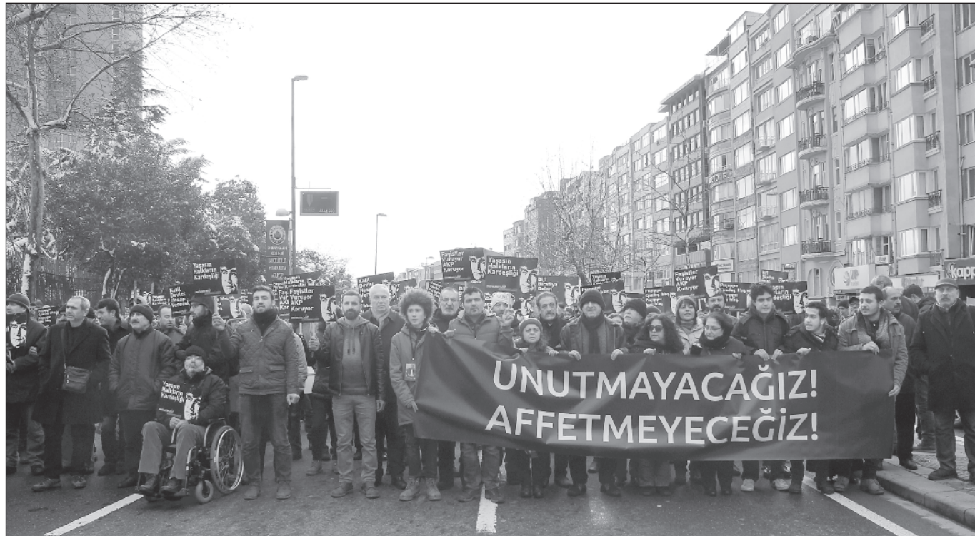
Յուցարարները կ'ընթանան Հարպիէէն դէպի Օսմանյակ